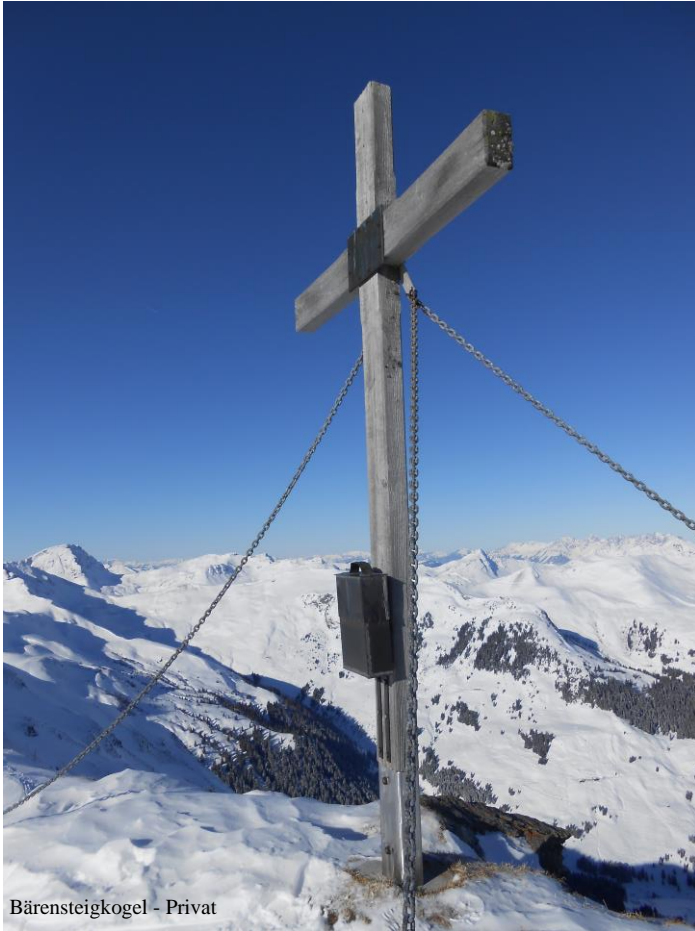
Bärensteigkogel - Privat