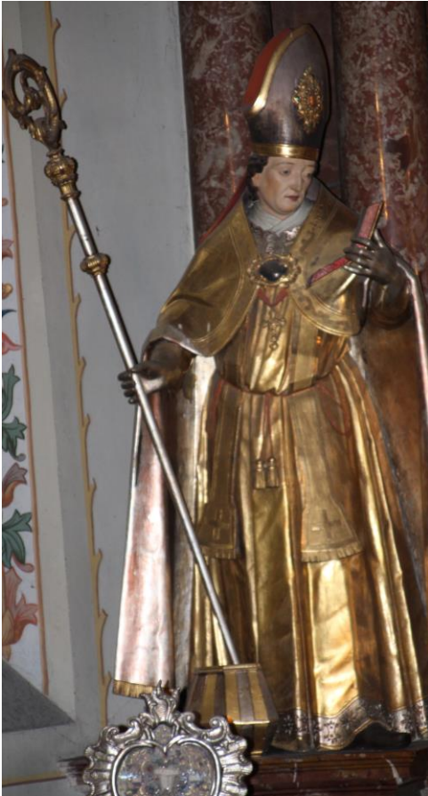
Hl. Rupert, Bischof, Landes- und Stadtpatron von Salzburg