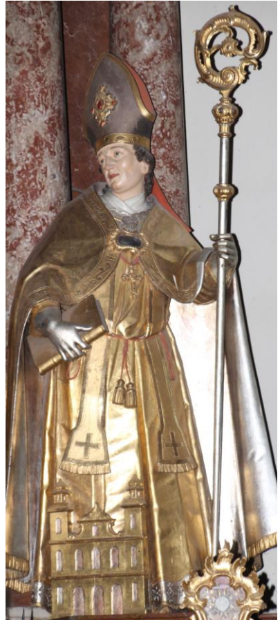
Hl. Virgil, Bischof von Salzburg